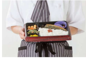
施設食・配膳サービス