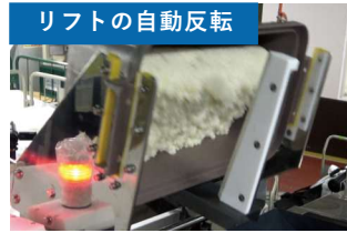
リフトの自動反転